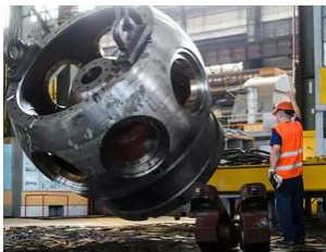
Construction de machines

Fondée en 2002 et basée à Darmstadt, en Allemagne, :em engineering methods AG est une société indépendante de conseil informatique et commerciale pour la transformation numérique du secteur de l'ingénierie dans les domaines du « Product Lifecycle Management », « Model Based Engineering » ainsi que « Application Lifecycle Management ». L'entreprise a également développé le logiciel ReqMan pour la gestion des exigences (« Requirements Management Software »). En 2024, l'entreprise a dépassé les 110 employés. Capital Transmission a investi aux côtés de ses fondateurs, de la direction, de Patrimonium et de Wille pour soutenir :em dans la croissance de ses activités, à la fois de manière organique et par le biais d'acquisitions.