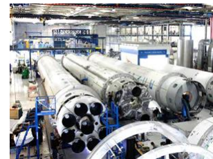
Luft- und Raumfahrt